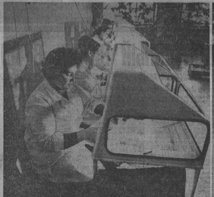
ПРОДУКЦИЯ Лепинск-Кузнецкого электромашинного завода хорошо известна не только у нас в Кузбассе, но и далеко за его пределами.