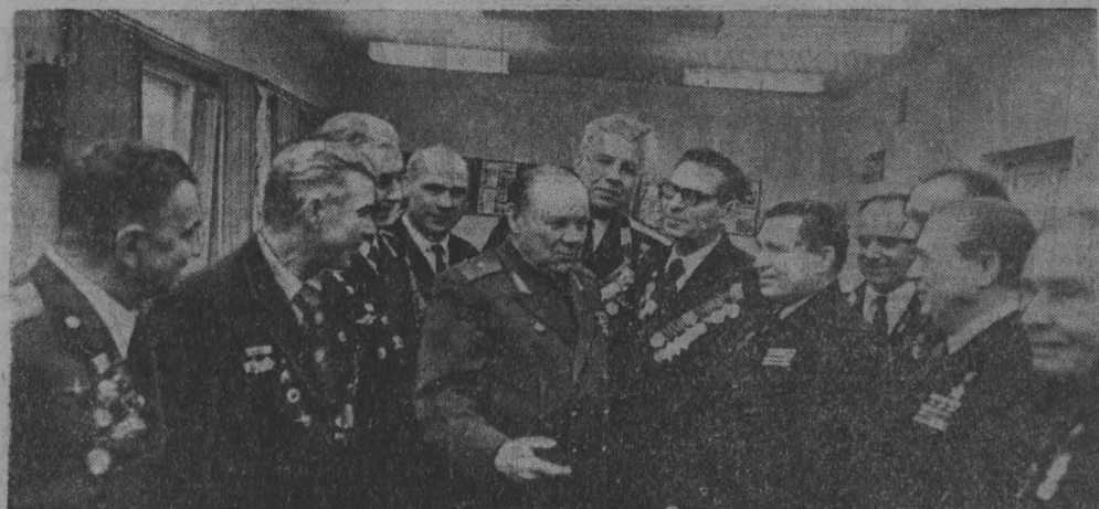
Фото П. Костюкова, г. Кемерово.

НА СНИМКЕ: группа участников встречи в редакции.