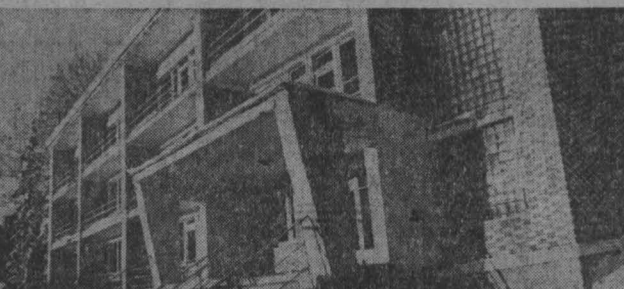
Профилакторий «Романтика» — любимое место отдыха жителей Междуреченска.

Большое значение имеет во время похода работа по благоустройству троп, оборудованию стоянок с целью охраны природы.