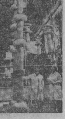
● МОСКВА. С большим воодушевлением восприняли коллектив производственного объединения «Электроавтомат» имени В. В. Куйбышева Письмо ЦК КПСС Совета Министров СССР, ВЦСПС и ЦК ВЛКСМ «О развертывании социалистического соревнования за выполнение и перевыполнение плана 1978 года и усиления борьбы за повышение эффективности производства и качества работы». Электроавтоматы решили выполнить план 1978 года 28 декабря, а 400 рабочих предприятия обязались завершить план трех лет десятилетия к 7 октября — первой годовщине новой Конституции СССР.

И все-таки мы делаем еще мало. Сделано лишь основное начало большого пути к развитию культуры в свете требований постановления ЦК КПСС и Совета Министров СССР. И. ЛУГОВЕНКО, заведующий отделом культуры Веловского горисполкома, г. Велова.