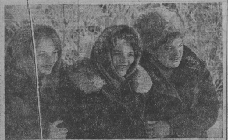
Доброй славы в колхозе «Заря» Ленинско-Кузнецкого района пользуется коллектив продовольственного магазина «Колос». Продавцы этого магазина стремятся к тому, чтобы каждый покупатель смог приобрести здесь необходимый ему товар — красивый и добротный. «Идти на встречу покупателю» — вот их девиз. Сотрудники магазина часто высказывают со своими товарам на животноводческие фермы, проводят различные мероприятия, например, в начале учебного года демонстрируют образцы товаров, со вкусом комплектуют праздничные и свадебные подарки.