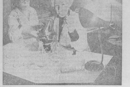
г. Юрга.

В СЕЛЕ Ягнубов есть улица, которую жители уважительно называют Орловской. Здесь целый ряд домов, в которых живут семьи с одинаковой фамилией — Орловы.