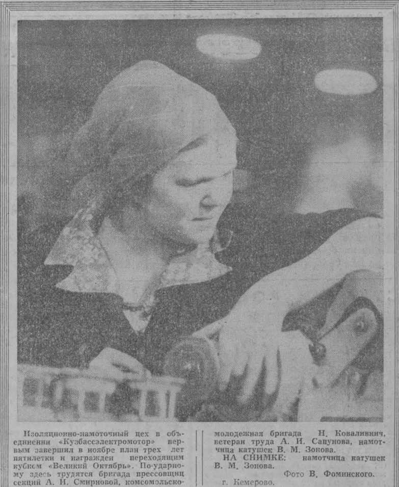
Изоляционно-намоточный цех в объединении «Кубасселктромотор»...