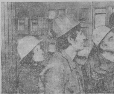
БОЛГАРИЯ. Сейчас 16 марок стали и ферросплавов, 200 видов проката черных металлов...