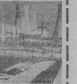
ЧЕХОСЛОВАКИЯ. Осуществлен пуск атомной установки первого блока АЭС-«В-1» в Яслово-Богунце, сооружаемой при техническом содействии СССР. Выработана здесь энергия атомом электричества заводов и фабрикам СССР. НА СНИМКЕ: общий вид атомной электростанции «В-1» в Яслово-Богунце.