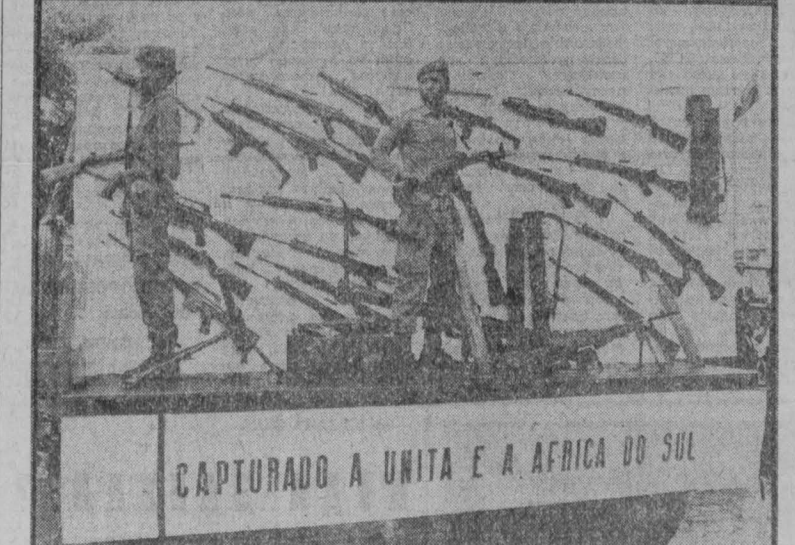
В своих агрессивных анциях против Народной Республики Анголы расисты ЮАР и головорезы из контрреволюционной группировки УНИТА используют оружие, изготовленное в странах — членах агрессивного блока НАТО. Не редко оно имеет и клеймо «сделано в Китае».

ИСЛАМАБАД. Пакистанское надельство «Дитта паблишинг хауз» выпустило массовый тиражом на языке урду двухтомник избранных произведений Генерального секретаря ЦК КПСС. Председателя Президиума Верховного Совета СССР Л. И. Брежнева. В него вошли речи и статьи Л. И. Брежнева по вопросам политики и внешней политики Советского государства.