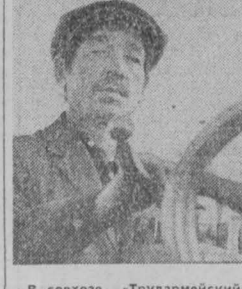
В совхозе «Трудармейский» на линейке готовности заняли свое место все посевные и почвообрабатывающие машины. Хорошо идет ремонт тракторов и зерноуборочных комбайнов.

К середине декабря совхозы и колхозы области внесли под урожай будущего года 1 372 тысячи тонн мела удобрений — 72 процента к заданию. В работу включены 171 механизированный отряд. Полевые Юргинского района успешно выполнили план, но работу по вывозке перегноя не прекращают. Высших темпов достигли хозяйства Ижморского, Ленинск-Кузнецкого, Тяжинского районов, по-