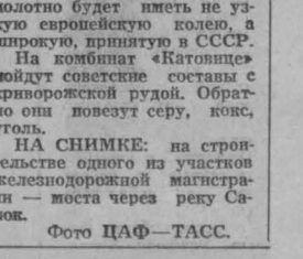
НА СНИМКЕ: на строительстве одного из участков железнодорожной магистрали — моста через реку Савок.