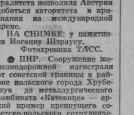
ВЕНА. Политика нейтралитета возмущает Австрию. Добиться авторитета и признания на международной арене. НА СНИМКЕ: у памятника Югану Штраусу.