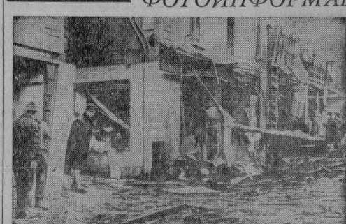
Волна мощных взрывов бомб вновь прокатилась по городам Северной Ирландии. В результате десяти человек ранены, в восьми городах возгорались сильные пожары, разрушено много зданий.