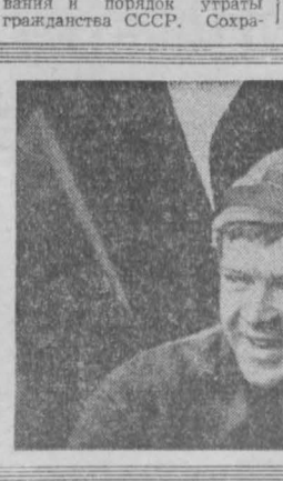
г. Кемерово.

Секретарь Президиума Верховного Совета РСФСР М. ЯСНОВ. Москва, 29 ноября 1978 года.