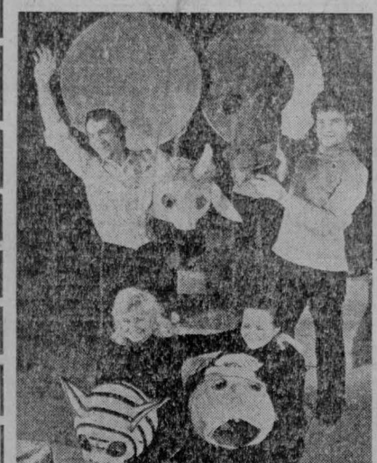
«Когда поют световоры» — так называется музыкальная сказка М. Азова, которая в этюдник увидела свет на сцене Кемеровского театра юного актёра А. Гайдара.

В ней действуют гномы — Красный, Желтый, Зеленый — управляющие световором, лесные зверята, пришедшие в город, мальчик Петя, кот Васа и старушка Авария. В форме игры на спектакле с ребятами ведется разговор о необходимости строго соблюдать правила уличного движения.