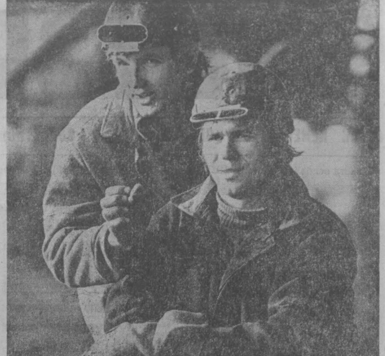
УДАРНЫМ трудом встретил праздник Октябрь трудящийся Запад-Сибирского металлургического завода.

Я. СЕВЕРНЫЙ, спец. корр. «Кузбасса», г. Белово.