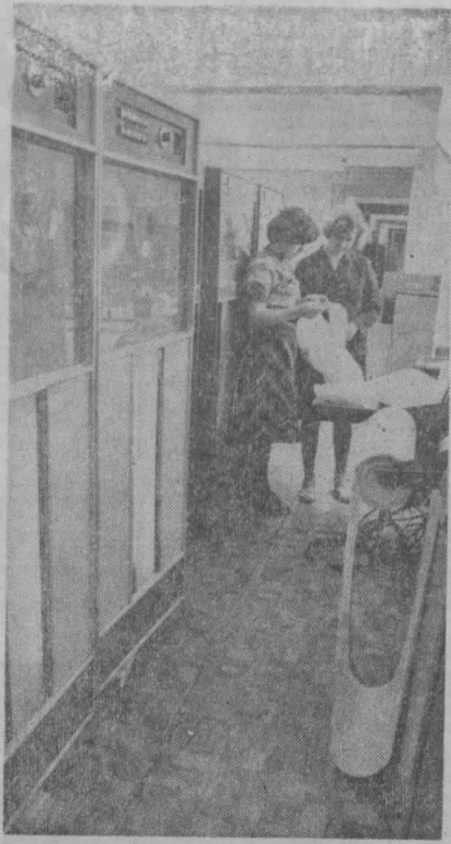
НА СНИМКЕ: в вычислительном центре управления материально-технического снабжения Кузбасского экономического района, где обрабатываются данные отдела писем газеты «Кузбасс».

и районам. В любой момент можем с помощью информации ЭВМ подобрать письма со всей области на одну тему. Короче говоря, ЭВМ помогает вести анализ с самых различных позиций. Достаточно сказать, что почту и публикуемые материалы мы классифицируем по тремстам признакам. Одна оговорка. Иногда нам трудно запомнить карточки «Письма» и «Газета» по той причине, что некоторые авторы не указывают, кем они работают, где уходят или находятся на заслуженном отдыхе. Все рассказанное здесь вовсе не означает, что новая система целиком держится на супер-технических средствах. Данные с ЭВМ — это лишь информация к размышлению. Письма как раньше, так и теперь внимательно читает человек. И часто не один. Сейчас, когда мы готовим и обсуждаем модель «Кузбасса-79», с особым нетерпением ждем каждую почту. Что она принесет? В практике знаем, что самые интересные публикации рождаются на основе авторских писем. Так что дорогие читатели, пишите нам о людях, которые рядом с вами работают и живут, о добрых крупных опытах, обо всем, что вам дорого и что важно у вас на душе. В. СПИРИНА.