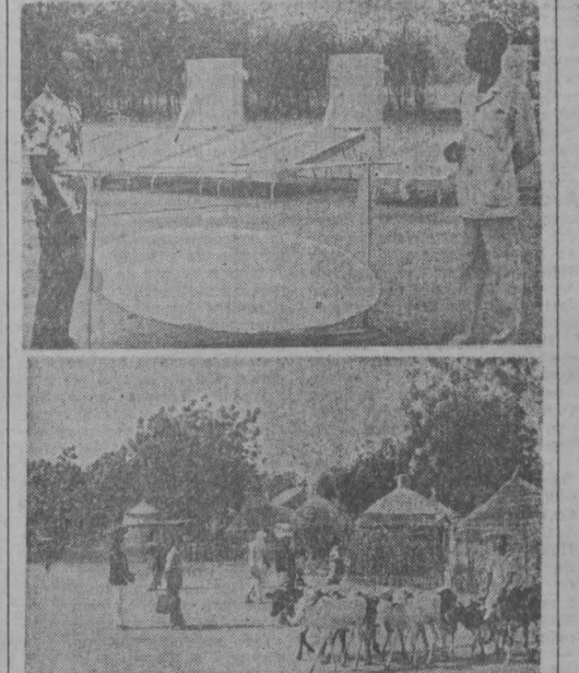
Республика Нигер расположена в центре Африки. Большую часть ее территории занимает пустыня Сахара.

Эта преимущественно аграрная страна в последние годы приобрела особую известность благодаря своим огромным запасам уранового сырья.