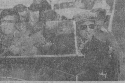
Фестиваль продлится восемь дней.