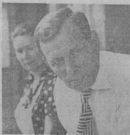
НА СНИМКЕ: кадры из фильмов «Чужая», «Трасса».