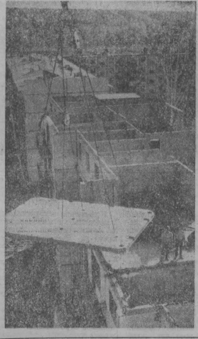
Хорошеть поселок строителей Ишкского гидроузла — Зеленогорский. За короткий период здесь выросли жилые здания, торговый комплекс, дворец культуры, детские комбинаты. Строит для тех, кто будет ставить плотину на Томи. Строит добротню, красиво, надежно. В этом году оно 200 семей уже получили квартиры.

Такая форма подачи информации помогла партийному комитету совхоза держать в курсе всех дел трудящихся. В. МОИСЕВ.