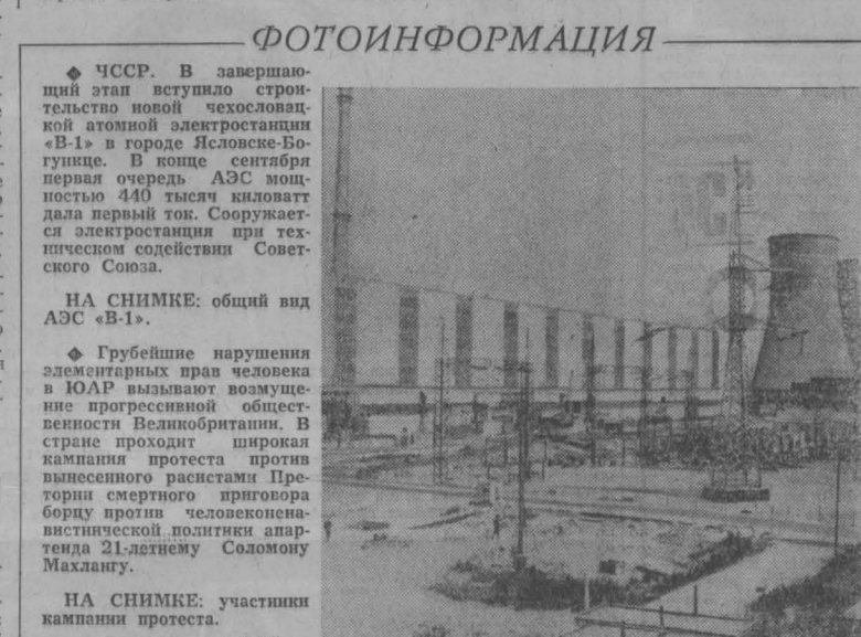
НА СНИМКЕ: общий вид АЭС «В-1».

графических картах КНР включена в китайские территориальные воды. Такая же картина наблюдается и в Восточно-Китайском море, где Пекин заявляет о своих правах на острова Сенкаку. Подобная «картографическая агрессия» на первый взгляд может показаться безобидной. Однако, как показали инциденты на границах Китая с Индией в 1953—1962 годах и на Парасельских островах в 1974 году, в определенных условиях она перестает носить абстрактный характер и выливается в кровавые вооруженные столкновения. Факты свидетельствуют о том, что раздувание Пекином проблем границ является активной формой оказания давления на сопредельные страны с целью вынудить их проводить или поддерживать политику, отвечающую великодержавным, гегамоистским целям «среднего государства». При чем подобная политика проводится и по отношению к тем государствам, с которыми Китай формально не имеет спорных территориальных вопросов. За примерами далеко ходить не надо. В 1967 году маоистские лидеры предприняли замышляемую неудачей попытку оказать политиче-