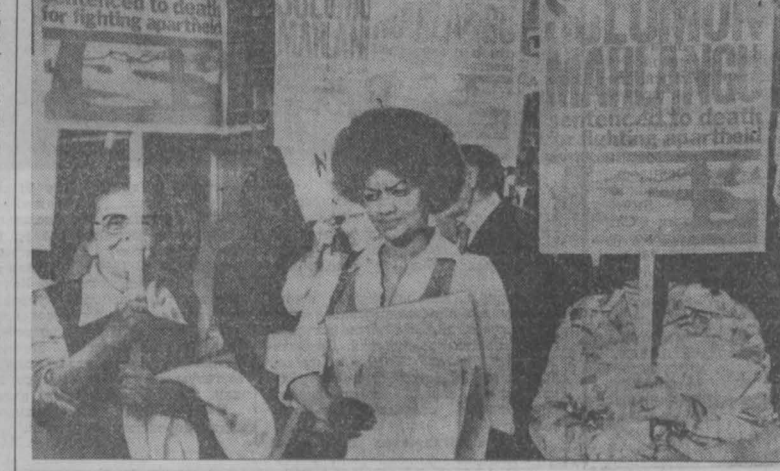
НА СНИМКЕ: участники кампании протеста.