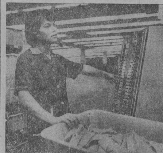
Кузбасс — Ноград

ПАРИЖ. Диктатор Сомоса удерживается у власти лишь благодаря американскому правительству, которое оказывает ему военную и политическую поддержку, пишет газета «Юманите». США подают диктатору организаторов отправки Никарагуа наемников, опасаясь прихода к власти в этой стране демократического правительства и подъема в Латинской Америке освободительного движения. Это выкладывает более чем копейки на фоне наемника Дик Картера «в защиту прав человека». (ТАСС).