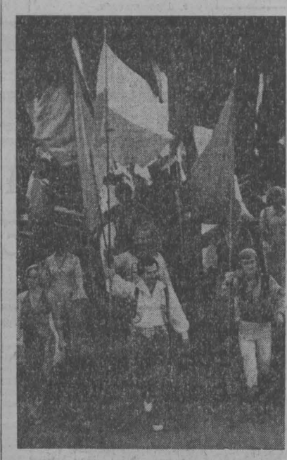
НА СНИМКЕ: артисты польского цирка «Варшава» выходят на традиционный парад-алле.