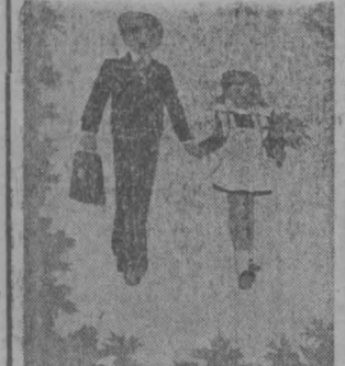
НА СНИМКЕ: кто в первой класс?

1 сентября во всех школах нашей страны начинается новый учебный год. Для многих ребят, которые пойдут в первый класс, школьный звонок прозвучит впервые.