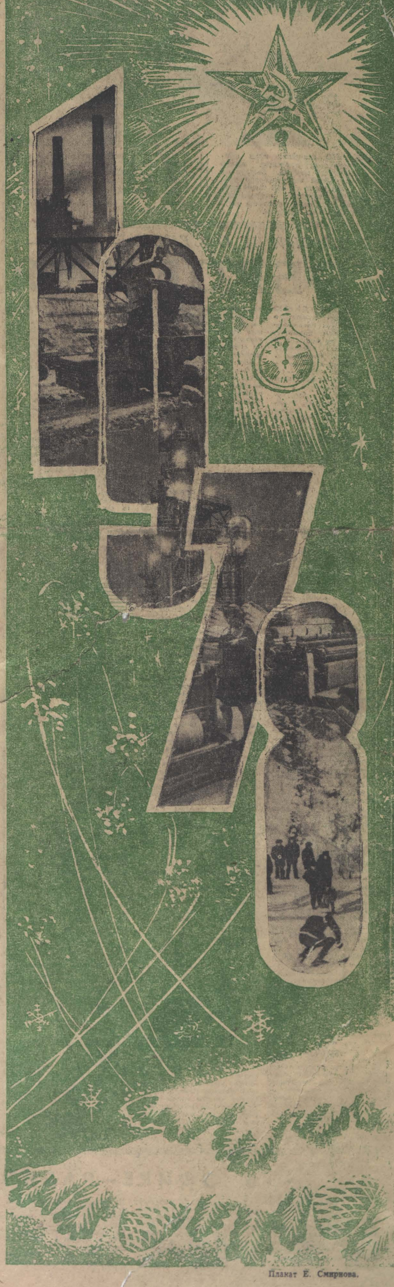
Плакаты Е. Смирнова.