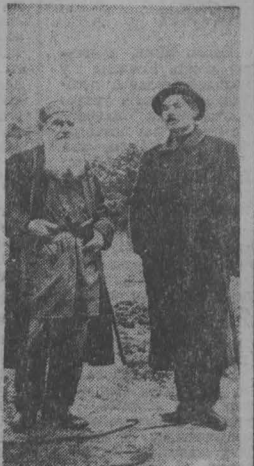
НА СНИМКЕ: Л. Н. Толстой и А. М. Горький в Ясной Поляне (1901 г.).