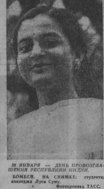
26 ЯНВАРЯ — ДЕНЬ ПРОВОЗГЛАШЕНИЯ РЕСПУБЛИКИ ИНДИИ.