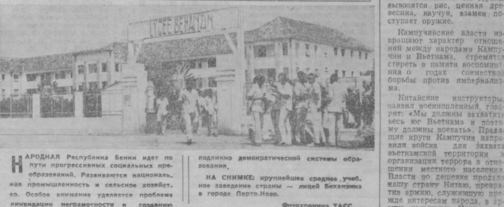
НАРОДНАЯ Республика Бенин идет по пути прогрессивных социальных преобразований. Развиваются национальная промышленность и сельское хозяйство. Особое внимание уделяется проблеме ликвидации неграмотности и созданию подлинно демократической системы образования. НА СНИМКЕ: крупнейшее среднее учебное заведение страны — лицей Бержезина в городе Порто-Ново.

Китайские инструкторы, заявил военнопленный, говорят: «Мы должны захватить весь юг Вьетнама и поставить там коммунизм». Провалившие круги Кампучии извращают историю захвата вьетнамской территории и организации террора в отношении местного населения. Власть по дешевой продали нашу страну Китаю, превратили армию, служившую прежде интересам народа, в армию наемников Китая.