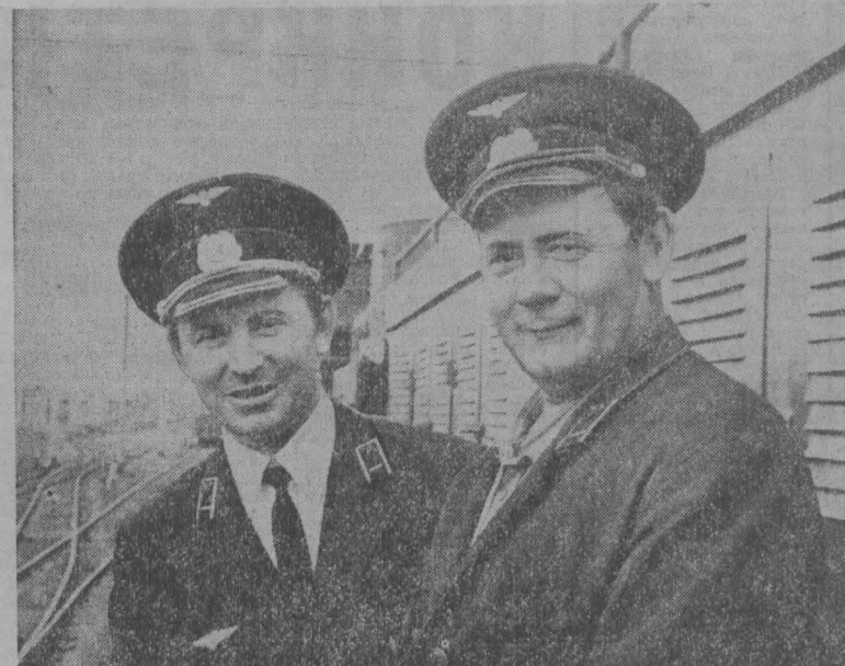
Хорошими трудовыми подарками встретили свой профессиональный праздник железнодорожники станции Кемерово. Большая работа ведется на станции по экономии топлива — энергетических и материальных ресурсов. Инициаторами этого движения в коллективе являются работники оборотного депо станции Пред.

БОЛЕЕ четырех десятилетий ежегодно в первое воскресенье августа страна чувствует трюмперские стальные магистрали. Благодаря постоянной заботе партии и правительства железнодорожный транспорт стал одной из крупнейших отраслей народного хозяйства.