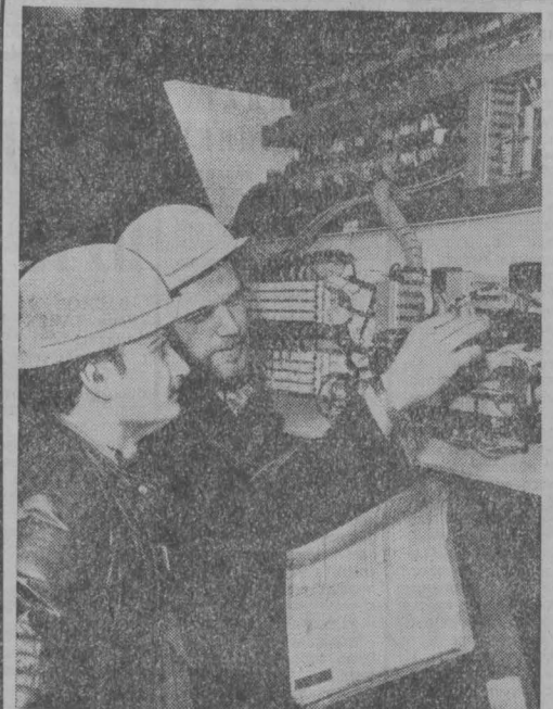
ПНР. Огромное значение для развития польской металлургии имеет сооружающийся с технической помощью Советского Союза комбинат «Катовице». Прошло всего полтора года с момента первой плавки. Сегодня комбинат дает свыше 20 процентов отечественной продукции стали. Предполагается, что в текущем году комбинат даст народному хозяйству свыше 4 миллионов тонн стали и 650 тысяч тонн проката.