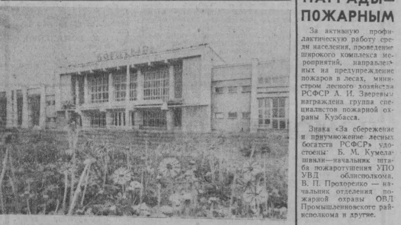
Десятки спортсменов тренируются ежедневно в спорткомплексе «Вогатырь». Это рабочие Зелимба, студенты и школьники. Особенно популярны здесь секции тяжелой атлетики, борьбы, акробатики. Спортсмены Зелимба — неоднократные призеры многих областных и республиканских состязаний. НА СНИМКЕ: спорткомплекс «Вогатырь». Зам. редактора А. И. БЕЛЬЧИК.

За активную профилактическую работу среди населения, проведение широкого комплекса мероприятий, направленных на предупреждение пожаров в лесах, министерством внутренних дел РСФСР А. И. Звереву награждена группа специалистов пожарной охраны Кузбасса.