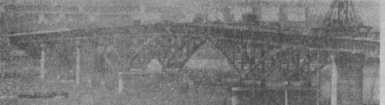
ОМСК. Закончен монтаж последнего пролета моста через Иртыш. Он соединит левобережный Кировский с промышленными Первомайским и Советским районами. НА СНИМКЕ: общий вид строящегося моста. Фотохроника ТАСС.

Одно из крупнейших предприятий отрасли — машиностроительный завод «Фамур» в г. Катовице. В нынешнем году коллектив предприятия изготовил 230 угольных комбайнов — на 40 больше, чем в прошлом году. В первом полугодии из технов завода вышло 122 комбайна, в том числе девять машин нового типа КВБ-6, сконструированных польскими инженерами и предназначенных для разработки четырехметровых угольных пластов. Новый комбайн хорошо зарекомендовал себя в шахтах «Забже» и «Пардиска» Польши, где проходили его эксплуатационные испытания. Ежемесячная добыча с помощью КВБ-6 достигла 2,735 тонн угля.