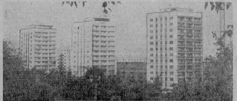
Интенсивно застраивается новый район Новонизинца — поселок металлургов Засписа. Ежегодно строятся сотни новоселов десятни тысяч квадратных метров жилья. г. Новокузнецк.

Ю. ИЗЮМСКИЙ, доцент, Л. ШУХМАН, старший преподаватель Кемеровского института культуры, г. Кемерово.