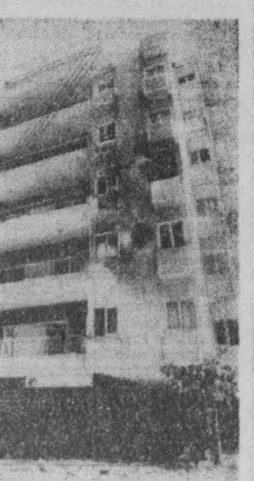
НА СНИМКЕ: один из домов, подвергшихся обстрелу.

Запад, заявил президент, выступая перед журналистами, закрывает глаза на тот факт, что французские вой-