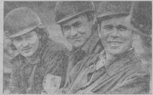
Кузнице монтажников — 30 лет