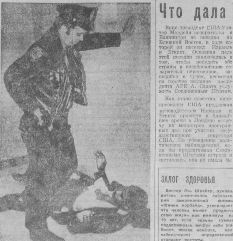
Американским «любителям порядка», давно получившим печальную известность «расистов в полицейских мундирах», практически предоставляется полное право на физическую расправу и даже убийство афроамериканцев. НА СНИМКЕ: вот так расправляются с афроамериканцами в полицейском участке Гарлема.

ли малейших шансов на успех. Действительно, Израиль, поощряемый извне, и слышать не хочет о выводе своих войск с оккупированных арабских земель. Египет же не может поставить подпись под таким текстом, который лишил бы арабов всякой надежды вернуться хотя бы в самый отдаленный будущий и хотя бы на некоторые из отобранных у них частей территорий. Нельзя не отметить, что, упорству в своих попытках склонить Египет к принятию условий Израйля, Соединенные Штаты грубо нарушают свои прежние обязательства, зафиксированные, в частности, в совместном советско-американском заявлении по Ближнему Востоку от 2 октября 1977 года. В нем прямо указывалось, что единственным правильным и эффективным путем обеспечения кардинального решения в комплексе всех аспектов ближневосточной проблемы является переговоры в рамках Женевской мирной конференции, которая специально была создана для этих целей. На Женевскую конференцию были, как известно, приглашены не только Египет, Израиль и США, но и все стороны, вовлеченные в конфликт, в том числе палестинский народ. Наконец, в конференции должен участвовать и Советский Союз — верный друг государства, оказавшихся жертвами агрессии. И все попытки создать иной механизм переговоров противоречат законным интересам арабских стран и в конечном итоге обрекают на провал. (ТАСС).