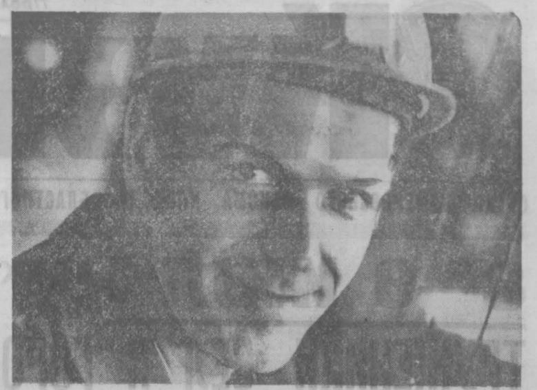
ОТЛИЧНЫЕ производственные показатели на счету коллектива обжигового цеха Западно-Сибирского металлургического завода. С начала года сверх задания прокатано более четырех тысяч тонн металла. В настоящее время обжиговщики работают в высоком производственном темпе. На счету коллектива значительное количество сэкономленных энергоресурсов.