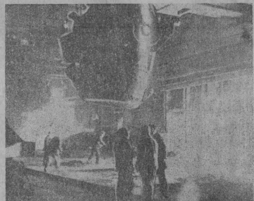
НА СНИМКЕ: идет разливка стали в мартеновском цехе Кузнецкого металлургического комбината.

Десятая пятилетка — это небывалая грандиозность замыслов и свершаемых дел. Это новый всесторонний подъем экономики страны, еще более демократичный несокрушимость могущества Родины, основы дальнейшего повышения благосостояния советского народа.