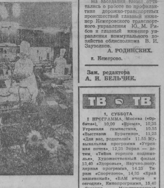
на стороне. Но не это главное. К хорошей квалификации прилагается максимум старания — вот и получается отличный результат. «Удивительное у вас дело!» — говорят посетители. «На здоровье!» — смеется Галина, — Стараясь». В. ГЕНКИНА. НА СНИМКАХ: торговый центр; перед открытием столовой девушки украшают столы живыми цветами. Кемеровский район.