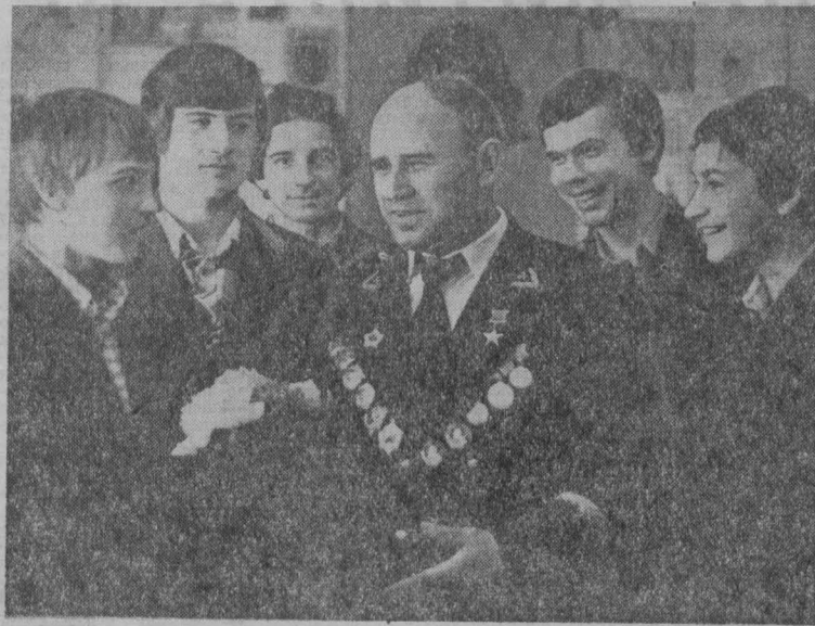
Герой Социалистического Труда И. И. Гриновец с шахты «Ювентал» г. Макеево среди учащихся городского технического училища № 2.

Вот почему шахтеры и металлурги Донецка призваны развернуть соревнование под девизом: «Уголь — кокс — металл».