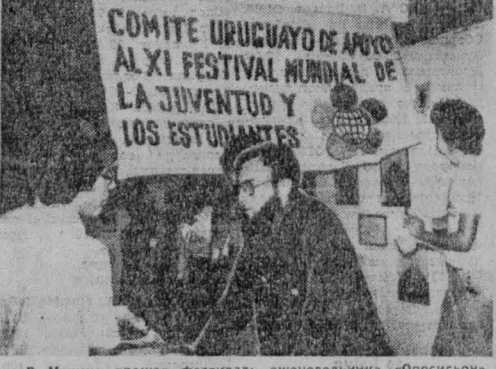
В Мехико прошел фестиваль еженедельника «Обсиссион» — печатного органа ЦК Мексиканской коммунистической партии. На фестивале присутствовали делегации братских партий из 25 стран. Выставочные стенды коммунистических газет «Аванте», «Гранма», «Прада», «Трибунал» и других рассказывали о жизни трудящихся в своих странах. Программу фестиваля «Обсиссион» включала мероприятия, посвященные предстоящему летом этого года в Гавае XI Всемирному фестивалю молодежи и студентов.

АДДИС-АБЕБА (ТАСС). Перед лицом преступного заговора международного империализма и реакционных арабских режимов против Эфиопии иропейские народы массы страны полны решимости отстоять единство, суверенитет и территориальную целостность своей родины, заявил председатель Всемирного военного административного совета (ВВАС) Эфиопии Менгисту Хайле Марьям.