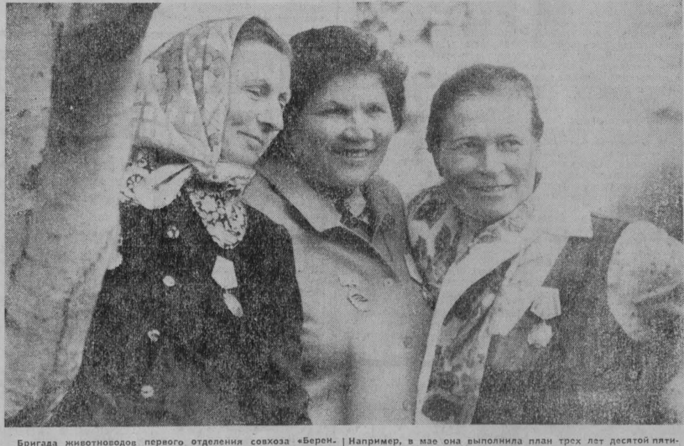
Бригада животноводов первого отделения совхоза «Бережас» — одна из лучших в области. В минувшем году доярки бригады получили по 4 058 килограммов молока от каждой коровы. В этом году обязательства животноводов еще более высокие — добиться по 4 070 килограммов молока от коровы. Передовая бригада успешно справляется с обязательствами.

Например, в мае она выполнила план трех лет десятилетия.