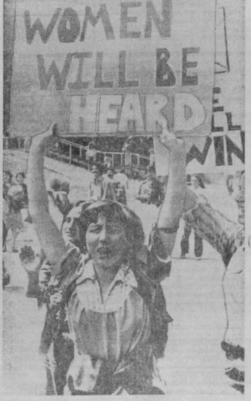
В Соединенных Штатах ширится движение за равноправие женщин. По данным министерства труда США, безработица среди американок в полтора раза превышает среднюю в стране, а заработная плата составляет 37 процентов среднего заработка у мужчин. НА СНИМКЕ: одна из участниц демонстрации против дискриминации.

Сообщая об этом случае, американская газета «Интернэшнл геральд трибюн» добавляет, что полицейские Роббинса отнюдь не сели в тюрьму. Они распущены на два месяца... с сохранением жалования, после чего будет объявлен новый набор на прибыльные должности. (АПН)