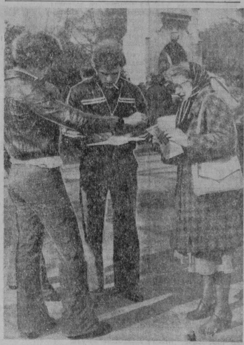
Выступая против предполагаемых планов США создать новые разновидности ядерного оружия, прогрессивная общественность Англии свою основную задачу видит в том, чтобы добиться полного запрещения нейтронной бомбы. Она решительно требует раз и навсегда отказаться от этого оружия массового уничтожения, поставить его вне закона. НА ШИМКЕ сбор подписей под петицией против нейтронного оружия в Лондоне.

Последнее время в Соединенных Штатах раздувается враждебная Советскому Союзу кампания, смысл которой заключается в том, чтобы прикрыть незаконные действия посольства США в СССР и отвлечь внимание от разведывательно-подпольной деятельности, проводимой американскими спецслужбами из здания посольства против Советского Союза. В ходе этой кампании американская сторона выдвинула провокационное обвинение в наком-то «проникновении» в здание посольства и утверждала, что в посольстве якобы обнаружены подслушивающие электронные устройства. В связи с этим МИД СССР следит за деятельностью разведывательных органов в посольстве США. В представлении указывается, что сотрудники американского посольства разрушили отопительные сооружения соседнего советского жилого дома и повредили систему охраны, представляющую собой ступень защитную меру в связи с разведывательно-подпольной деятельностью американских спецслужб. Советская сторона, отмечая в представлении, располагает убедительными свидетельствами того, что в здании посольства США в течение длительного времени проводится специальная работа, радиополетная разведка по перехвату линий связи, в том числе радиотелефонных переговоров. В руках советских компетентных органов имеются подлинные разведывательные задания и оперативные журналы уаваанных постов. В представлении содержится требование незамедлительно прекратить деятельность американских незаконных работ, полного восстановления причиненного разрушения и прекращения провокационной кампании.