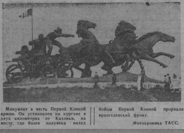
Монумент в честь Первой Конной армии. Он установлен на кургане в двух километрах от Каховки, на месте, где более полувека назад бойцы Первой Конной прорвали врагледский фронт.

старших инженеров, инженеров, техников, техников-электриков, желающих работать по КИП и А. Переподготовка будет осуществляться на специальных курсах при управлении.