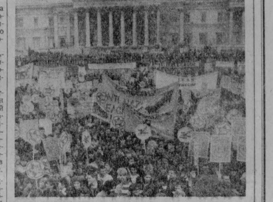
АНГЛИЯ. Прогрессивная общественность страны с гневом и возмущением выступает против разгрома расширения Британских Overseas. НА СНИМКЕ: во время демонстрации против расширения и неофашизма в Лондоне.