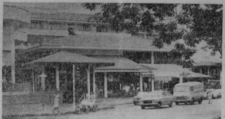
Экспорт копры и ванили, а также добыча и продажа перламутровых ракушек и жемчуга — главные источники доходов островного населения. В последние годы значительно развиты туризм.

Поэтому одним из главных направлений совершенствования структуры аппарата управления предприятия как раз и является нахождение правильного сочетания централизации и децентрализации. Иными словами, централизация функций оперативного управления должна сочетаться с децентрализацией функций центрального управления.