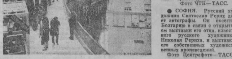
Представительный смотром достижений социалистических стран стала IX Международная ярмарка товаров широкого потребления в Брно.