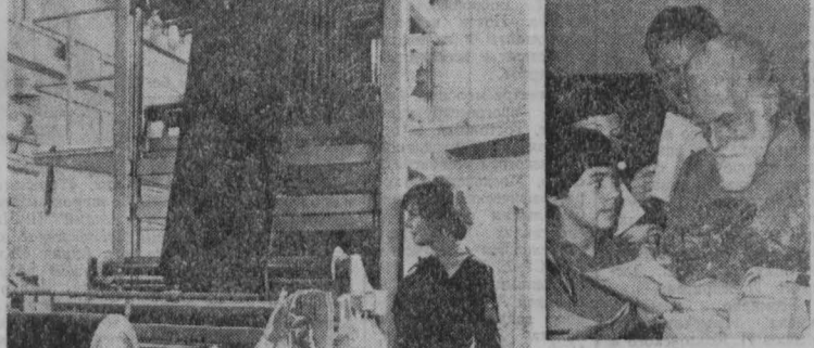
Завод ФАТРА — единственное в Чехословакии предприятие, специализирующееся на выпуске негорючих транспортных лент.