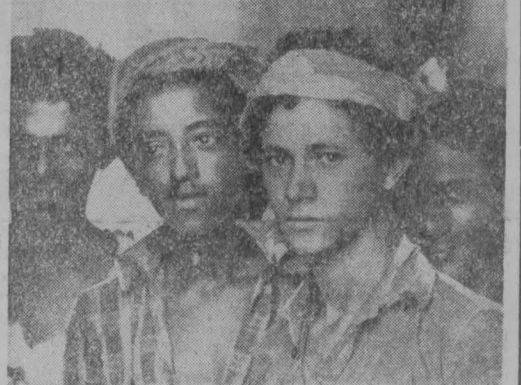
Народно-Демократическая Республика Йемен. Большие изменения происходят в жизни этого небольшого государства на юго-западе Аравийского полуострова.