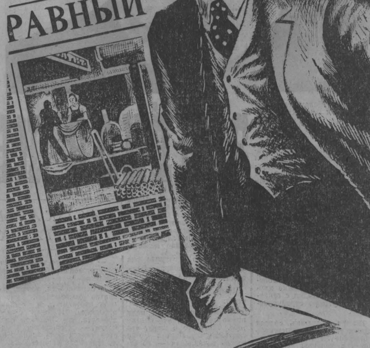
Рис. Г. Гуськова.

Советская партия Советского Союза ПРАВДА Центрального Комитета КПСС Среда, 4 мая Цена 3 коп.