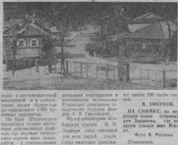
Музей-заповедник «Сибирская ссылка В. И. Ленина» — святыня для всех людей земли. Сюда ежегодно приезжают тысячи туристов...