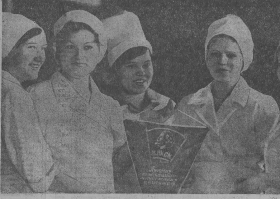
Производственно объединение «Организа» поставило синтетические департаментные препараты сотням городов, рабочих поселков, сел и деревень нашей страны.

Ничего очень медленно идет формирование финансирования сельского строительства. К середине апреля заказчиками открыто финансирование только на 76 процентов от плановому объему. Серьезного упрека прежде всего заслуживает объединенная дирекция строительных предприятий областного управления сельского хозяйства (г. Айрих). Из плановых 8.042 тысяч рублей в настоящее время оформлено финансирование на строительные-монтажные работы в объеме 118 тысяч рублей.