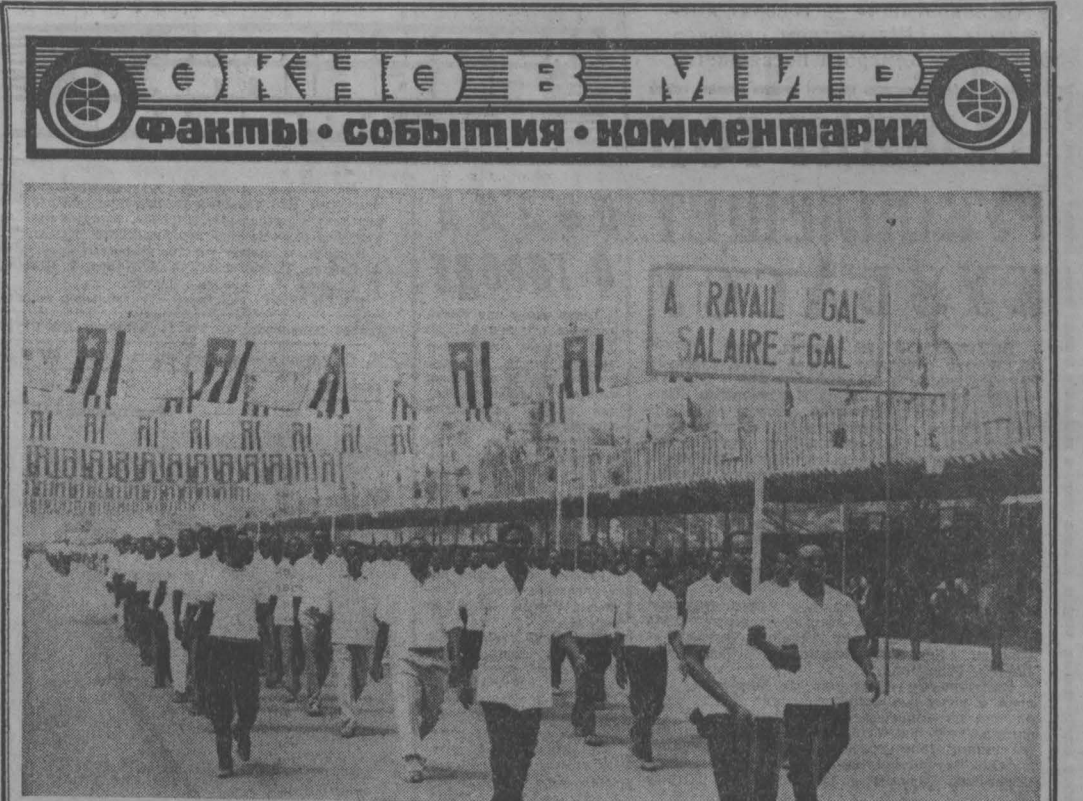
ТОГО. Вместе со всеми трудившимися вчера тоговестьский рабочий класс готовится отметить День международной солидарности трудящихся — 1 Мая. НА СНИМКЕ: колонна Национальной комиссии по труду...