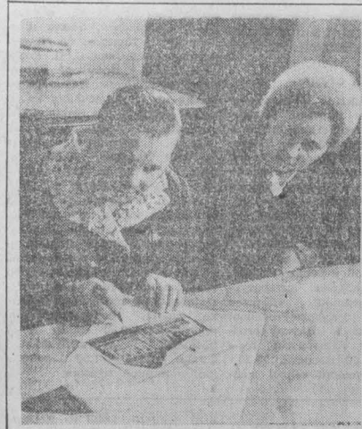
К 70-летию со дня рождения С. П. Королева (1907—1966), советского ученого, конструктора ракетно-космических систем