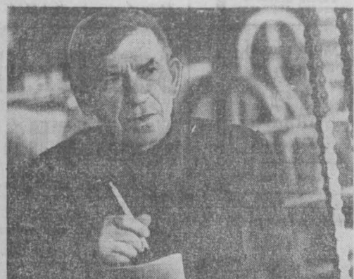
Хороших надежд добиваются в новом году животноводы Кароллинского молочного комплекса совхоза «Черкасовский».