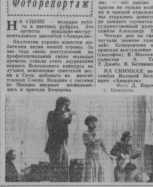
На сцене - молодые ребята в цветных рубашках. Это артисты вокально-инструментального ансамбля «Акварели».

Кредо нашего ансамбля выражено в его названии. «Акварели» - это значит разнообразие красок не только всей программой, но и каждой отдельной песни.