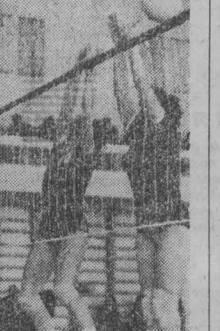
В Кемерове завершился зональный турнир женских волейбольных команд общества «Труд». Победители волейболистки Томска. Вторую путевку в финал завоевали спортсменки Хабаровска, третьими были кемеровчанки.