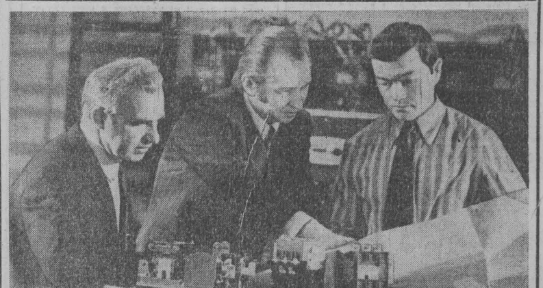
ПРОДУКЦИИ — ЗНАК КАЧЕСТВА