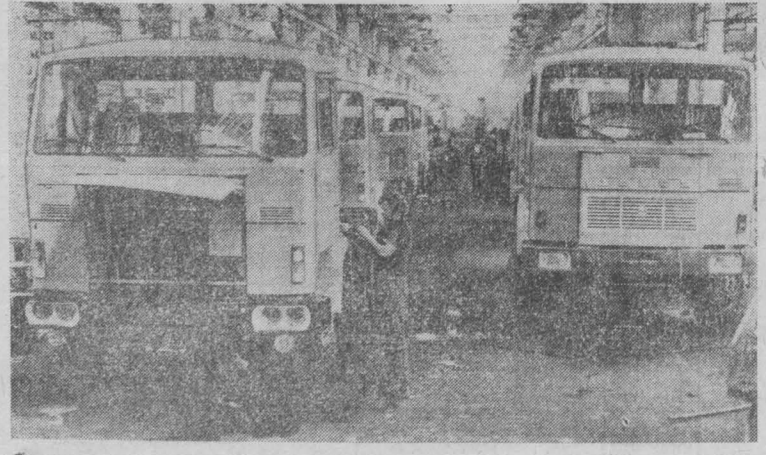
Корреспонденты АПН сообщают:

Свою первую продукцию завод даст уже в нынешнем году. (ТАСС).