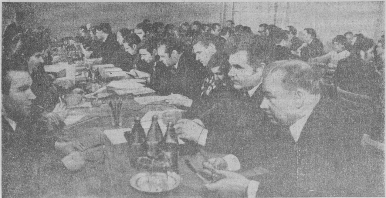
НА СНИМКЕ: УЧАСТНИКИ СОВЕЩАНИЯ.