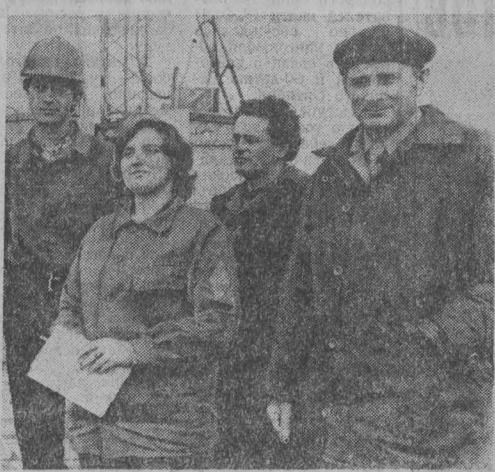
В Татабанском угольном бассейне, близ деревушки Мань, работает советская геологоразведочная экспедиция.