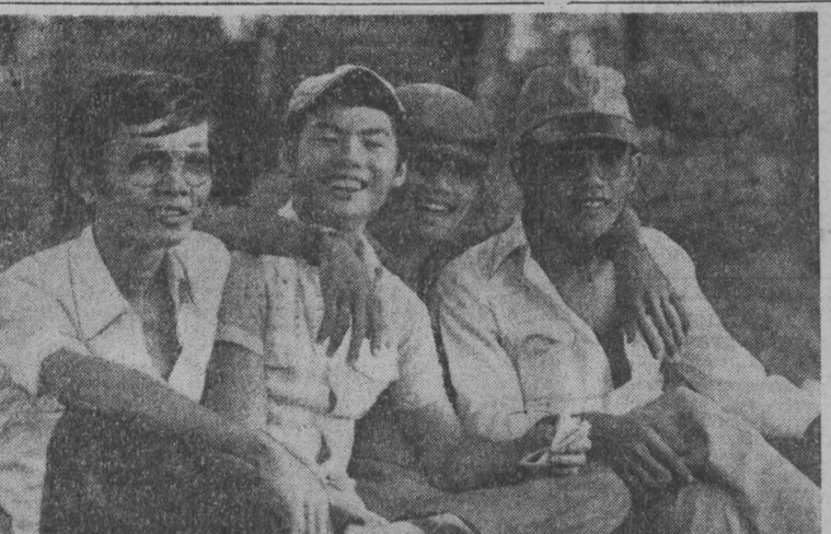
Молодежь Социалистической Республики Вьетнам активно включилась в борьбу за выполнение второго пятилетнего плана преобразования экономики, рассчитанного на 1976—1980 годы. Горячий отклик юношей и девушек всей страны вызвала инициатива рабочих Ханойского инструментального за-