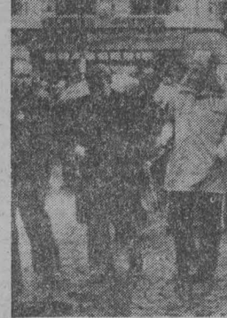
Франция. Колонны трудящихся (на снимке) прошли по центральным улицам Парижа от Северного вокзала до площади Оперы. По призыву крупнейших профсоюзных объединений ВКП и ФДПР рабочий класс осудил полицейские и судебные репрессии против бастующих поли-

Независимая Африка полна решимости бороться и победить. Ныне рассеялись иллюзии относительно какого-то миролюбия антинародной клики в Родозии.