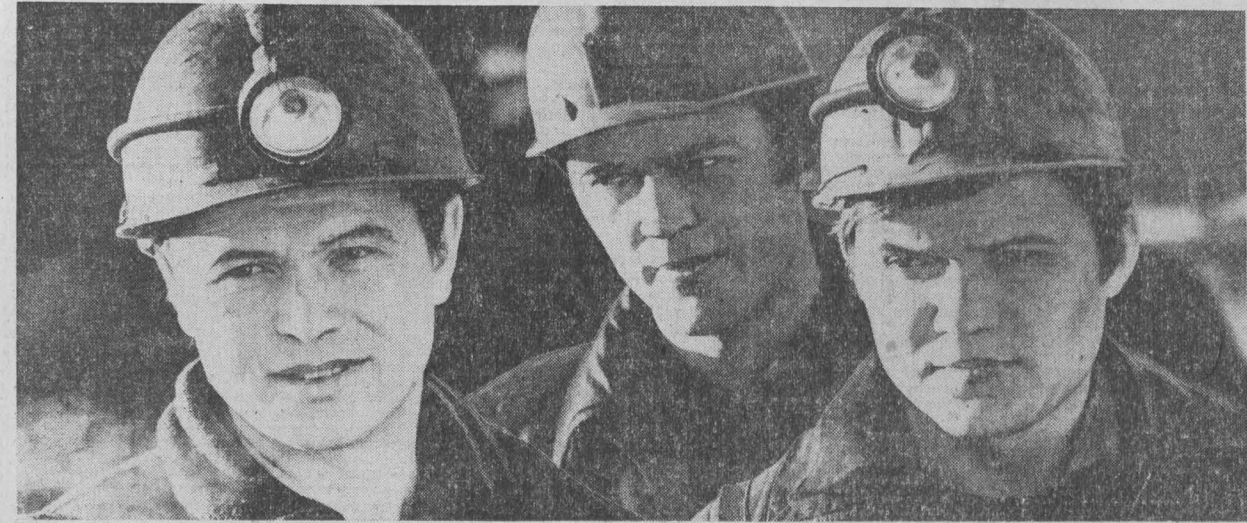
г. Междуреченск, шахта «Распадская».

Строителям, монтажникам, эксплуатационникам, проектировщикам, всем участникам строительства третьей очереди шахты «Распадская».