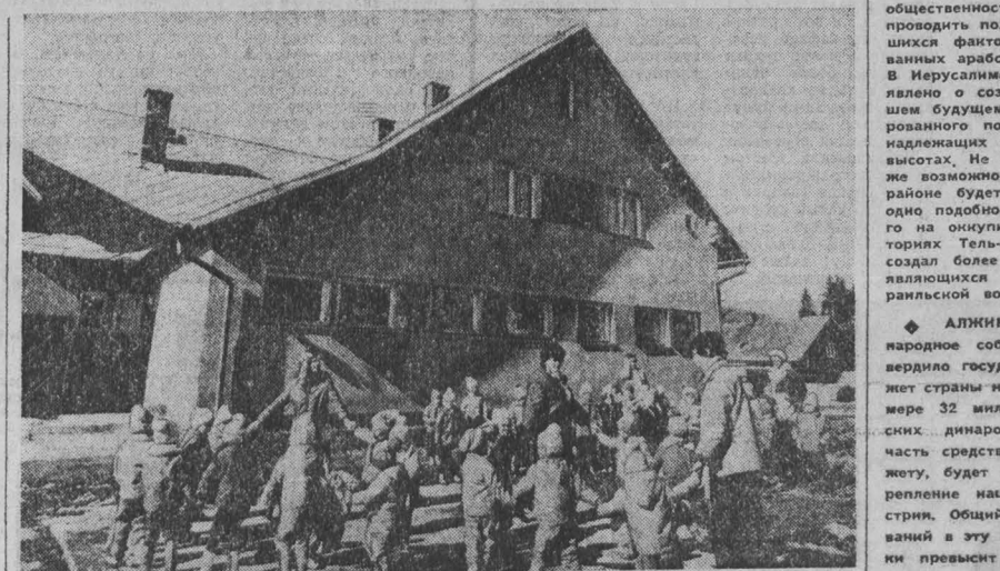
Маленькие граждане Чехословакии охвачены заботой и интересом к своему делу. В стране открыты сотни детских садов и яслей, консультации, поликлиники, больницы.

МАНАМА (БАХРЕЙН). Спец. корр. ТАСС Ю. Сенкевич передает: После завершения ремонта в Манаме тростниковая лодка «Тигрис» выходит в воды Персидского залива и берет курс на Ормузский пролив. В первые дни предстоит освоить новый парус, привезенный из Гамбурга, проведя после ремонтных работ и более чем месячного пребывания на воде. Все члены экипажа здоровы, мечтают выйти в море, настроены: всех привожают.