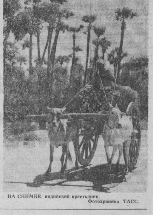
НА СНИМКЕ: индийский крестьянин.

♦ ПАРИЖ. На 182 тыс. человек увеличилось с ноября 1976 по ноябрь 1977 года число безработных во Франции, сообщает по данным профсоюзного объединения ВКТ, 1.612 тыс. трудящихся. В настоящее время, подчеркивает ВКТ, каждый второй безработный во Франции не получает никакого социального пособия. ♦ ЯНГОЗЯ. Против прекращения существующих связей Кипра с общим рынком выступил союз кипрских крестьян. В письме его генерального секретаря, адресованной министру торговли и промышленности, выражается серьезная обеспокоенность по поводу взаимовыгодных условий торговли Кипра со странами «Общего рынка».