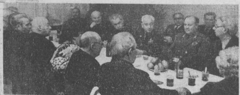
Крулый стол «Кузбасса»